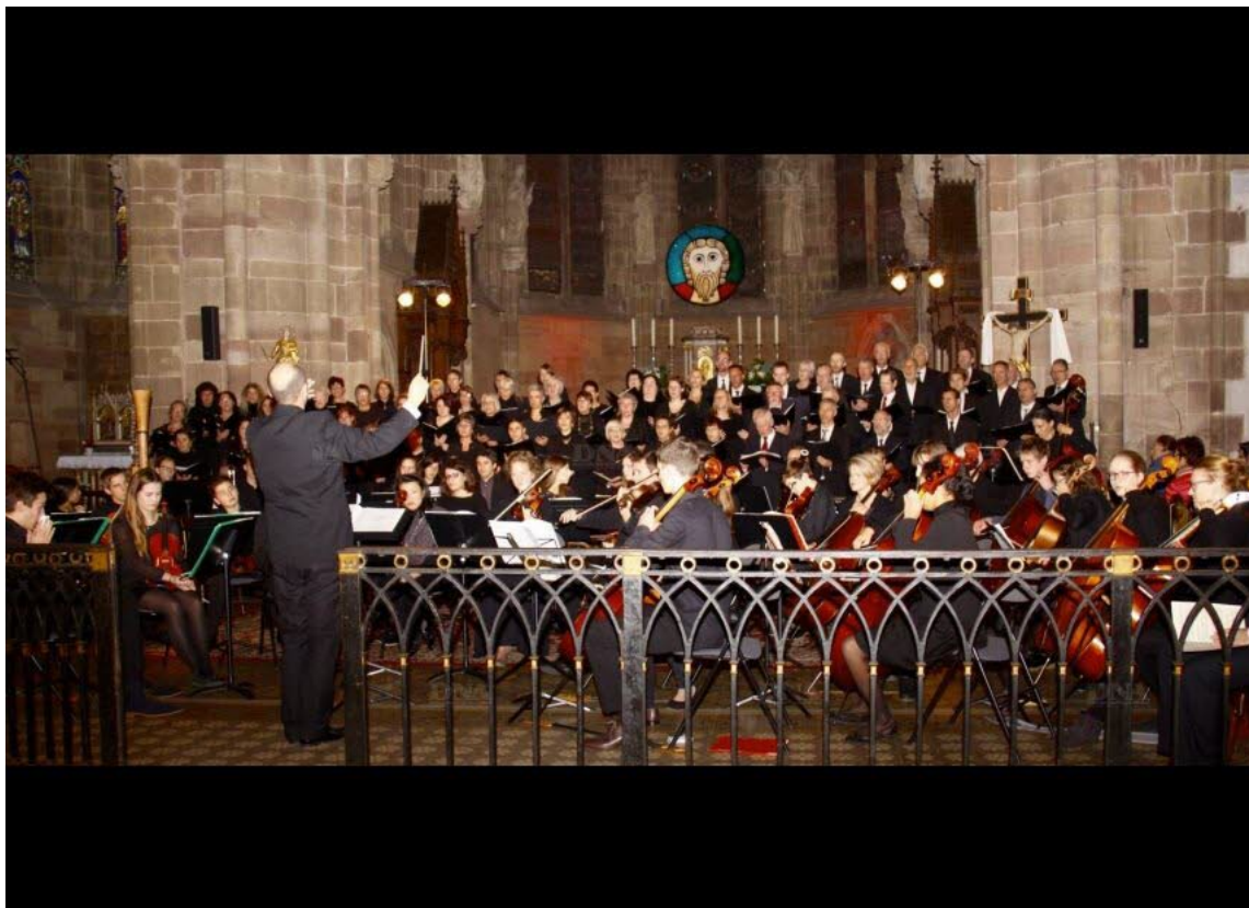
L'ensemble « Chordial » a donné un concert d'exception sous la baguette d'Orlando Schenk.

« Chordial », le concert préparé en commun depuis un an par des ensembles vocaux et musicaux alsaciens et palatins, a été salué dimanche dernier à l'abbatiale de Wissembourg par un auditoire subjugué de plus de 600 personnes !