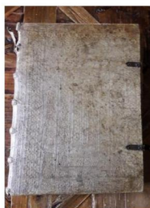
À GAUCHE Le missel du XIII e siècle nécessite une restauration professionnelle : son dos est notamment abîmé.