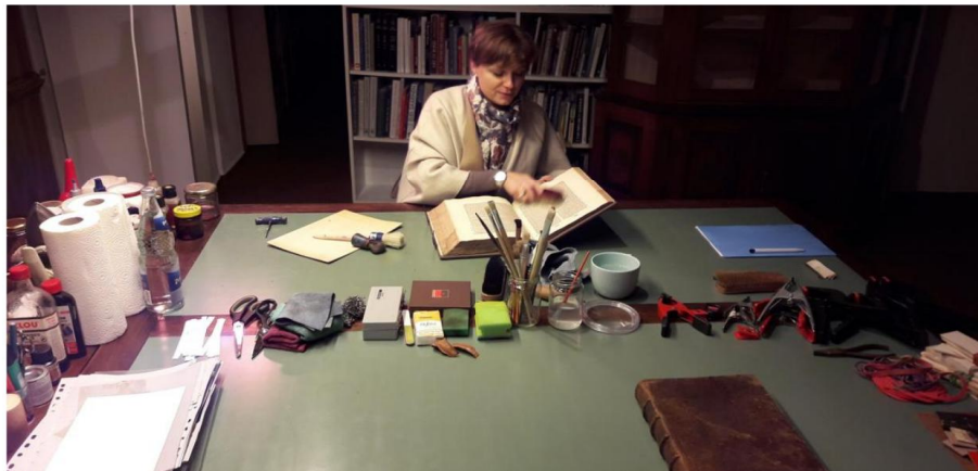
Dans l'atelier du Palais Stanislas, une petite équipe s'est formée pour restaurer les livres anciens peu abîmés.