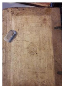
AU CENTRE Au moyen d'une simple gomme, l'on peut redonner une belle apparence à la couverture d'un livre.