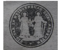
Le tampon attestant de l'appartenance à l'abbaye de Wissembourg.